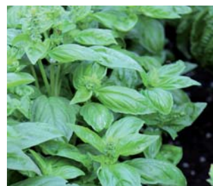
659060 Dark Green