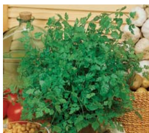
659200 Anthriscus cerefolium