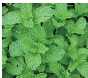
659350 Mentha spicata