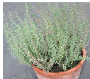
659600 Thymus vulgaris