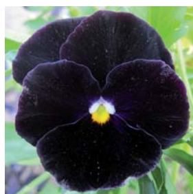
8120 Black King