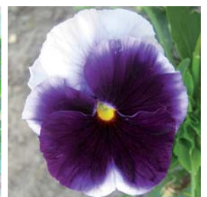
8150 Lord Beaconsfield