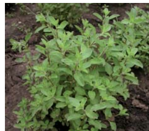
620010 Majorana hortensis