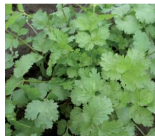
659620 Coriandrum sativum