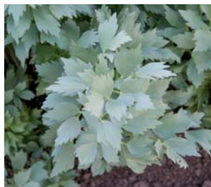
659300 Levisticum officinale