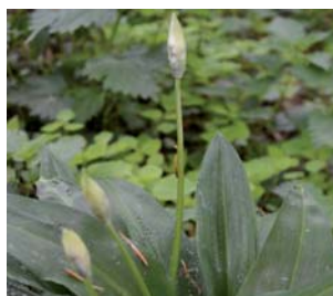
659150 Alium ursinum