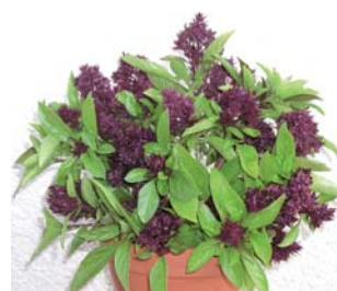
659030 Siam Queen