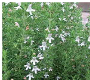
659500 Satureja hortensis