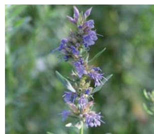
659650 Hyssopus officinalis