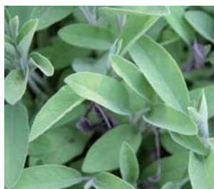
659630 Salvia officinalis