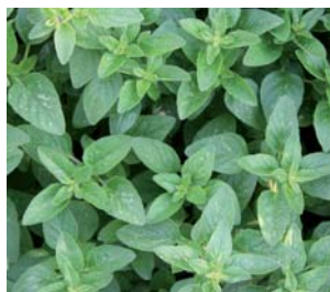
659100 Origanum vulgare

Thymus vulgaris (659600) tymián obecný – nízký polokeř s drobnými lístky, které se přidávají do polévek, omáček a k ochucení různých druhů masa a ryb.