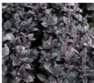
659070 Purple Opaal