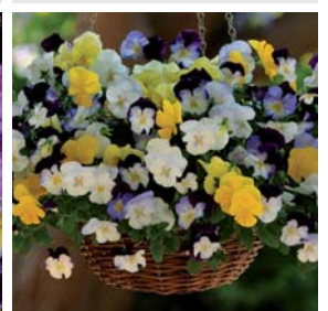
Cool Wave F1