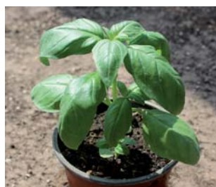
658950 Mammolo Genovese