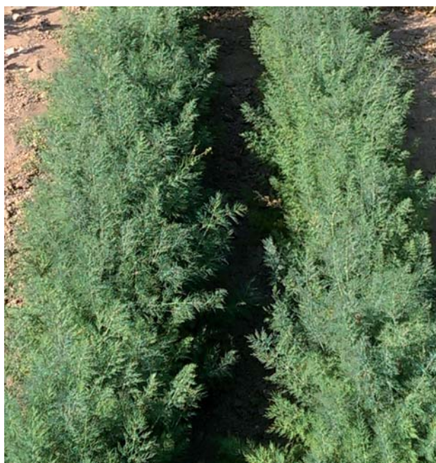
616020 Kopr keřkový Kurland

659080 Lettuce Leaf je bujně rostoucí odrůda se světle zelenými bublinatými listy.