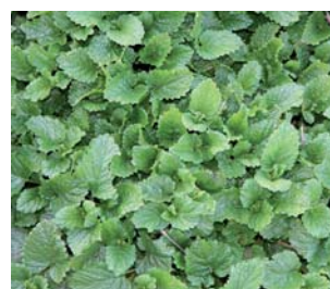
659400 Melissa officinalis