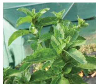
659640 Stevia rebaudiana