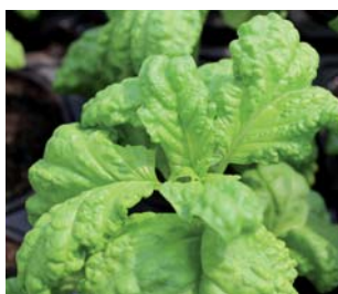
659080 Lettuce Leaf