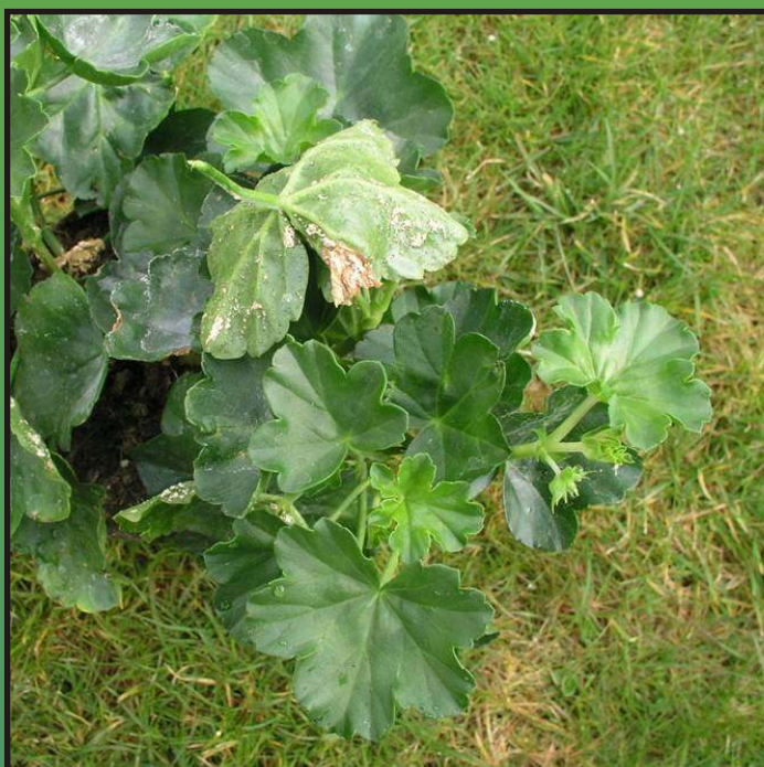
Obr. 3. Poškození roztoči (rostlina Pelargonium peltatum )