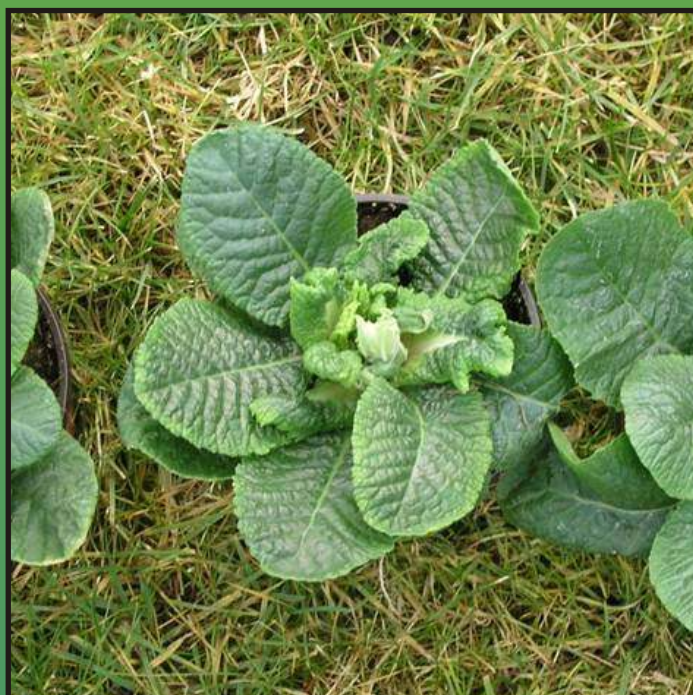
Obr. 4. Poškození roztoči (rostliny Primula acaulis )