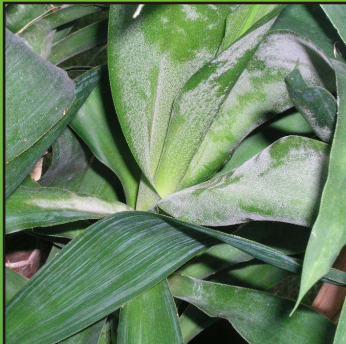
Obr. 2. Roztoč Phytocopella yuccae (rostlina Yucca )