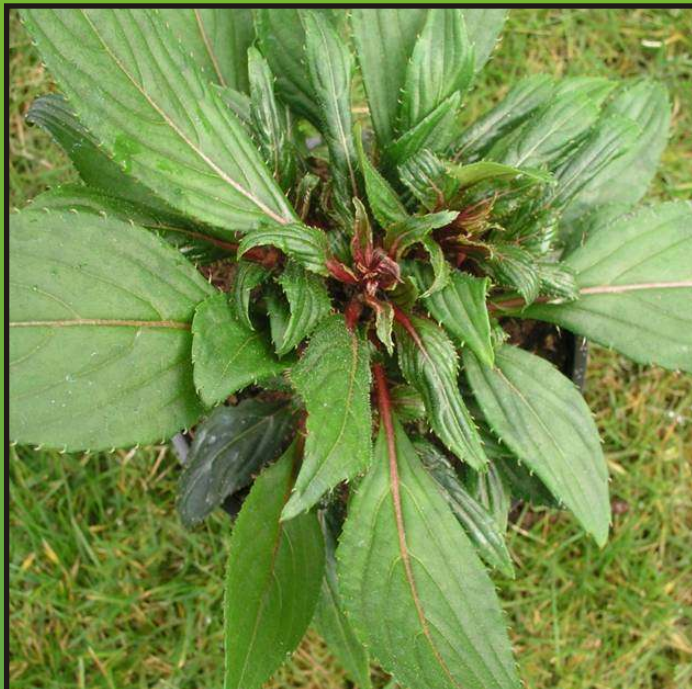
Obr. 1. Poškození roztoči (rostlina Impatiens New Guinea )